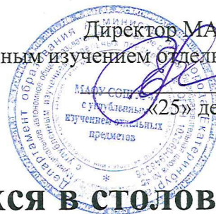
График питания учащихся в столовой МАОУ СОШ № 43 с углубленным изучением отдельных предметов на второе полугодие 2024-2025 уч. года.